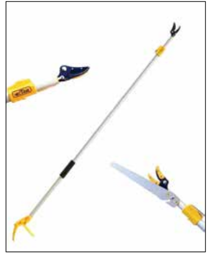
शेवगा काढणी अवजार