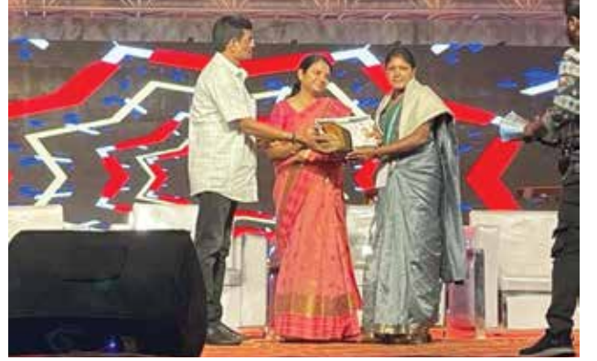
चांदा अॅग्रो - २०२४ मध्ये पुरस्काराने सन्मानित.

सेंद्रिय शेती आणि शेतीपूरक व्यवसाय करताना त्या वेळोवेळी कृषी विज्ञान केंद्र सिंदेवाही यांचे मार्गदर्शन व सल्ल्याचा योग्य वापर करतात. गांडूळ खत निर्मिती, कुक्कुटपालन, शेळीपालन आणि इतर शेतीपूरक व्यवसाय करताना त्यांनी वेळोवेळी कृषी विज्ञान केंद्रातील