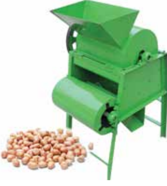
भुईमूग फोडणी यंत्र